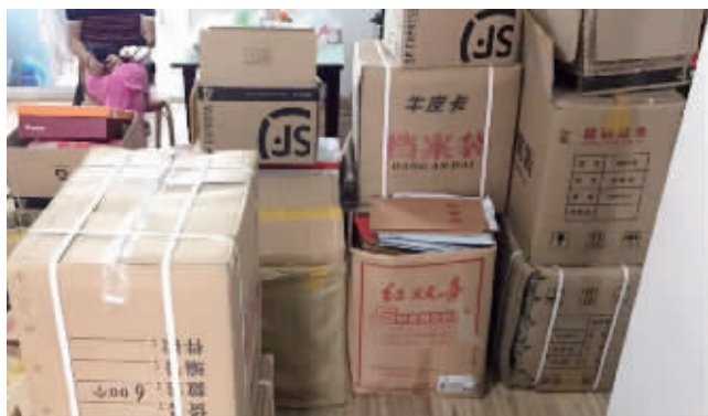
警方查获的假证