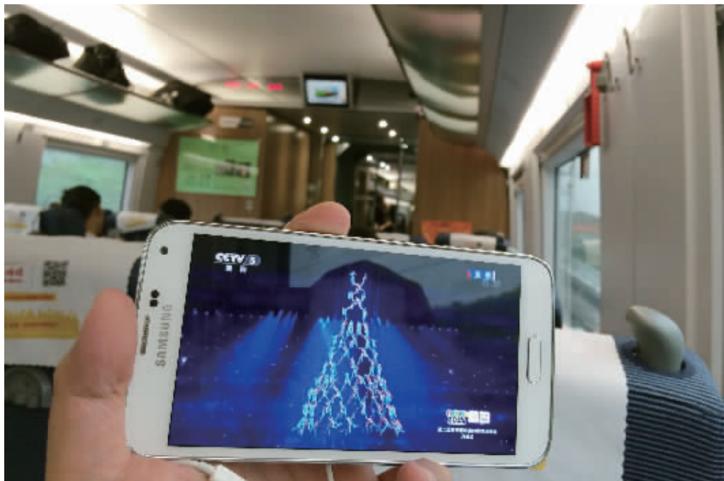
江苏移动4G用户在高铁上流畅地观看在线视频