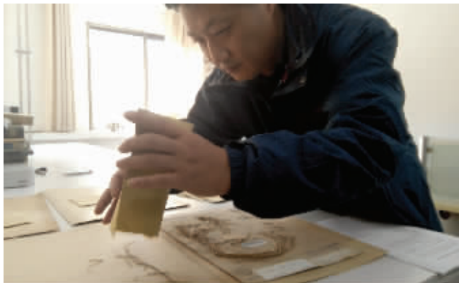
徐馆长整理追回的标本