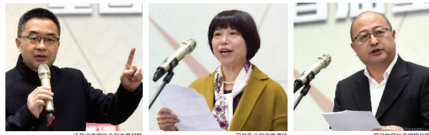
江苏省作家协会副主席祁智