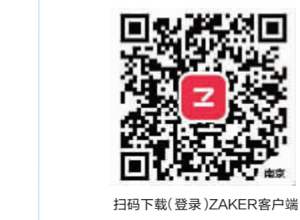
扫码下载(登录)ZAKER客户端