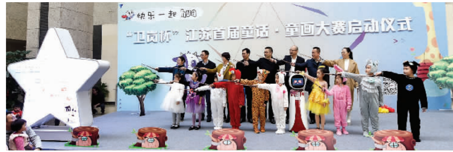
见习记者 谢毓灵 现代快报/ZAKER南京记者 徐红艳 谢喜卓 王颖菲/文