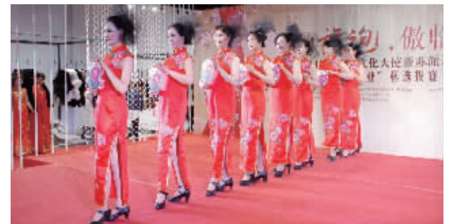
南京市文化馆老年大学艺术团8名队员在海选中

快报讯(记者 郝多)上个月,“奥林皮业”杯第二届世界旗袍文化大使暨苏派旗袍形象大使选拔赛正式启动。10月21日起,海选比赛在南京极具创意气息的奥林皮业创意工厂店举行。海选中,一支老年艺术团非常亮眼。