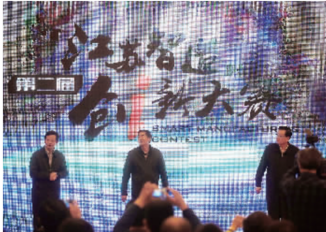
第二届“江苏智造”创新大赛南京预赛现场