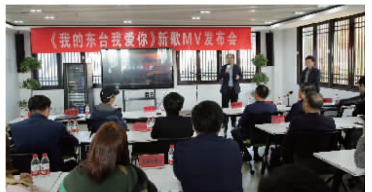
《我的东台我爱你》新歌MV发布会

“作为国家4A级景区、江苏省影视基地,西溪旅游文化景区努力突破传统旅游局限,不断增强互动性、体验感。”东台西溪景区相关负责人