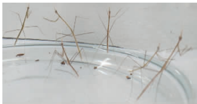
截获的竹节虫

快报讯(通讯员 吴晶 见习记者 耿朴凡)在网上看到心仪的昆虫,可不能随便网购。近日,江苏南京检验检疫局邮局办事处在一个来自英国某研究机构的邮包中,截获了6头活体竹节虫。根据国家有关规定,活体昆虫属于禁止邮寄物。检验检疫工作人员将对这批竹节虫进行检疫鉴定并做销毁处理。这批竹节虫是南京一位市民从英国某研究机构网购来的。该市民称,自己是昆虫爱好者,买回来准备饲养、观察。