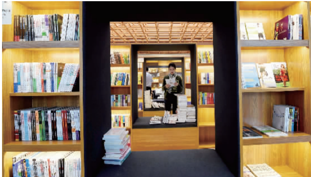
凤凰云书坊将24小时开放