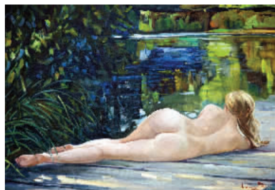
《水边》卡梅涅夫·阿列克谢·瓦西里耶维奇