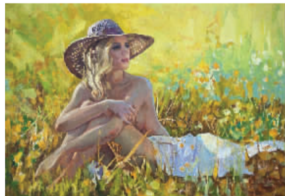
《花丛中的女人体》卡梅涅夫·阿列克谢·瓦西里耶维奇