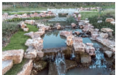
生态景观

今年，又实施牛首山-谷里园街联动、区域共建战略，形成独具特色的文化休闲旅游带，产生更好的集群效应。在49平方公里共建区域，将按照文化旅游度假区、产业综合区、养老养生区、乐活商住区和新市镇融合区“五大功能板块”布局，积极打造“旅游+”特色产业。