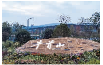
东入口标志墙

艺术周期间还举办“佛顶艺海”海峡两岸佛教书画艺术展、纪念赵朴初诞辰110周年艺术展，游客们可以大饱眼福。据悉，文化艺术周活动将持续到11月10日。