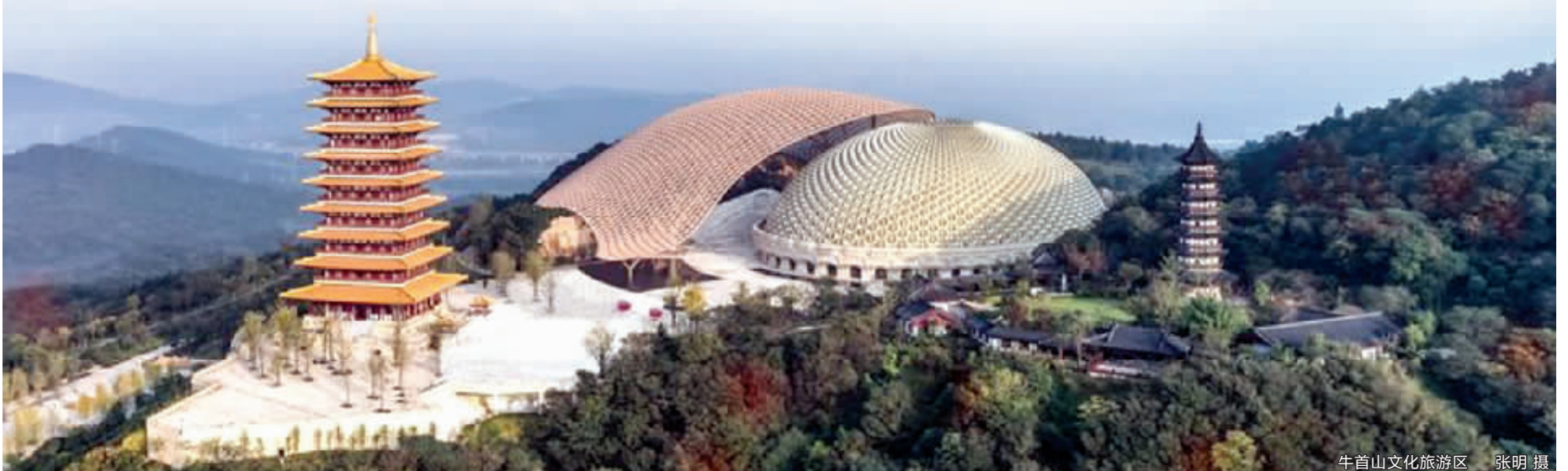
牛首山文化旅游区