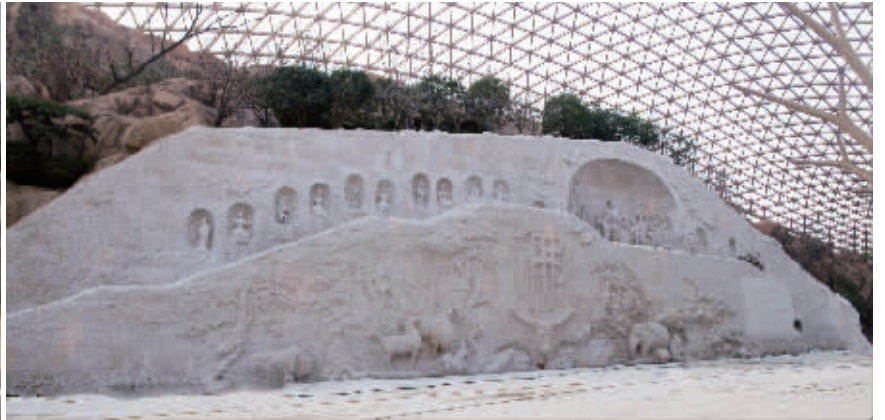
摩崖石刻