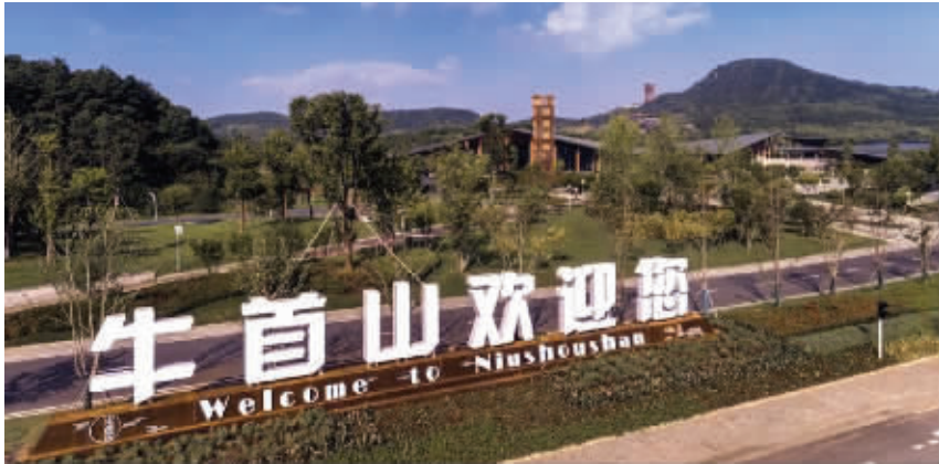
牛首山欢迎您