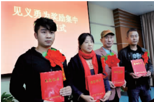
被表彰的见义勇为人员