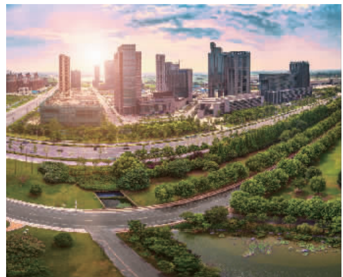
一座现代化大健康产业新城雄姿初展

“创新是园区发展的动力源泉,也是生物医药产业持续发展的生命力。”陆春云介绍,近年来,中国医药城始终坚持创新发展理念、创新发展思路、创新发展模式,初步探索走出一条集聚高端人才、引进高端成果、落户高端企业、发展高端产业的特色园区新路径,正在打造成为国内外知名的生物医药产业新地标。