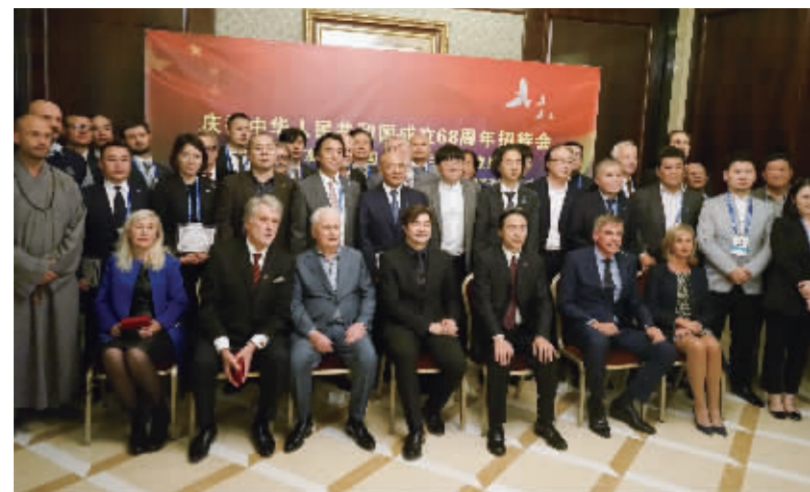
中国驻乌克兰大使杜伟、乌克兰文化部长尼休克、乌克兰首任总统克拉夫丘克、前总统尤先科与中乌全体艺术家在基辅洲际酒店展览现场合影