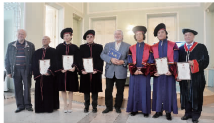
乌克兰国家艺术学院院长、著名画家安德烈·威培根向中国画家颁发荣誉院士、荣誉教授、美术家荣誉证书并合影