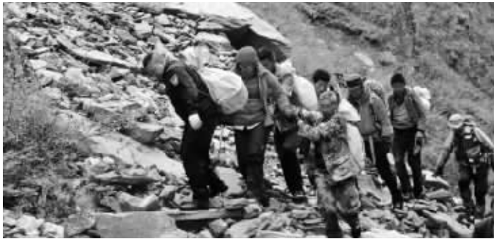
救援队营救3名被困驴友

10日下午4时30分,经6天5夜的救援,涉嫌违规穿越卧龙无人区被困的3名驴友终被营救上山。10月12日,卧龙森林公安局对违规穿越保护区的3名驴友进行了处罚:除了每人5000元的罚款外,3名被救人员还需共同承担4万余元的救援费用。