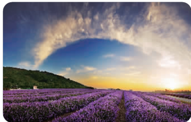
雪浪山生态景观园