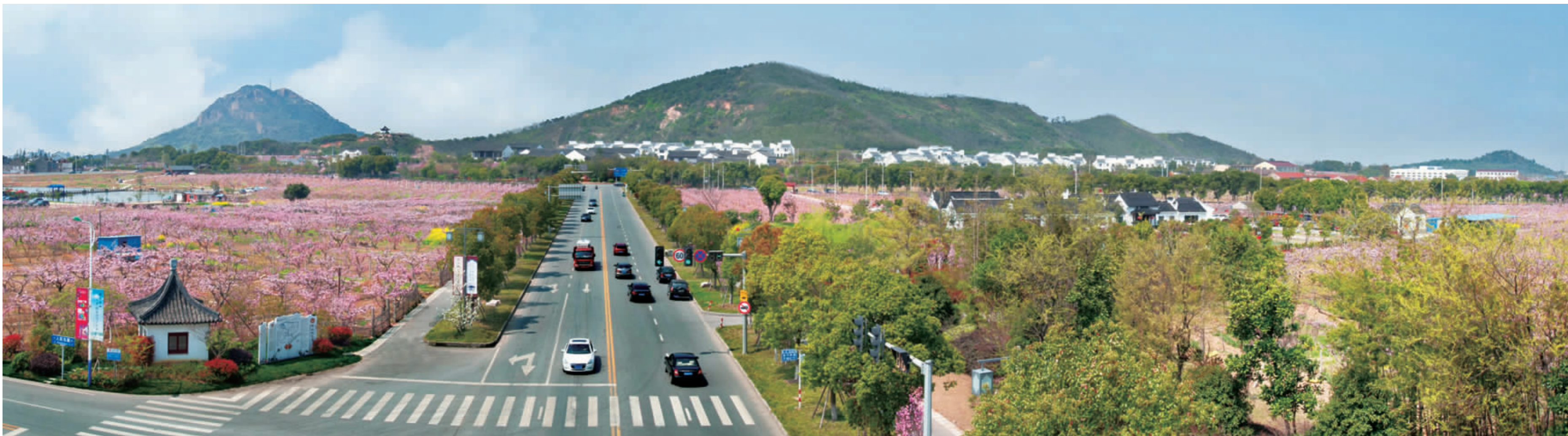
春满阳山