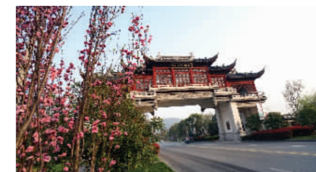
阳山桃文化博览园