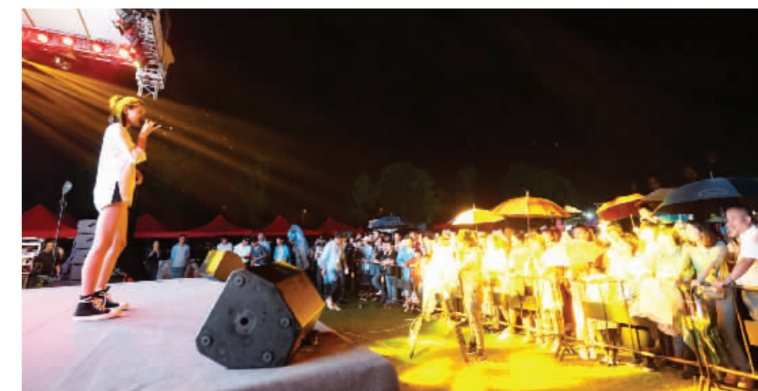
露营节举办音乐会

美食是休闲旅游不可或缺的元素,一地的风物人情能在小小的一道本地菜中展露无遗。全国称绝的阳山水蜜桃自不在话下,惠山物产丰富,民情朴实,以农家菜为代表的土菜,以及取当地食材制作的阳山麦饼,也是各路食客老饕不能错过的美食。玉祁黄酒,双套酿造,大酵法技艺,江南一绝。玉祁糟烧酒有无锡小“茅台”之美誉。水蜜桃、糕团、大麦饼、阿三阿四豆制品、生态香米、有机蔬菜、桃园草鸡蛋,成了让吃货们念念不忘的美食。玉祁“三绝”中的玉祁水芹,乾隆下江南多次钦点,年年进贡……惠山的农家乐在无锡远近知名,不少食客驱车从市区前来,就是为了品尝走地鸡、河塘鱼、田垄菜,它们可是经过最朴实安全的烹饪方法呈现的自然原味。今天,手巧的惠山人更是用创新创意带来新农家菜,用桃胶替代白糖精心熬制的山芋羹、农家走地鸡制作的麻香鸡、用农家老黄瓜和芋头混搭的家常菜肴,带来口味和视觉的双重享受。相约惠山,筑梦惠山,乐游惠山,不为桃粉、翠绿、文墨书香,只为钟灵毓秀。