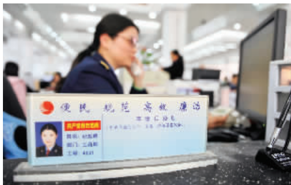
本版图片为忙碌的工商窗口