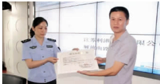
检查企业污水处理设施运行

无锡市坚持以智能化、绿色化、服务化、高端化为引领，持续推进产业调整和转型发展，从源头上减少污染排放。一方面，设立了200亿元现代产业发展扶持资金，出台促进现代产业发展的系列政策，大力发展物联网、新能源、新材料等八大战略性新兴产业，目前，无锡市内，入围中国企业500强、中国制造业500强的企业数均居于江苏省第一位。