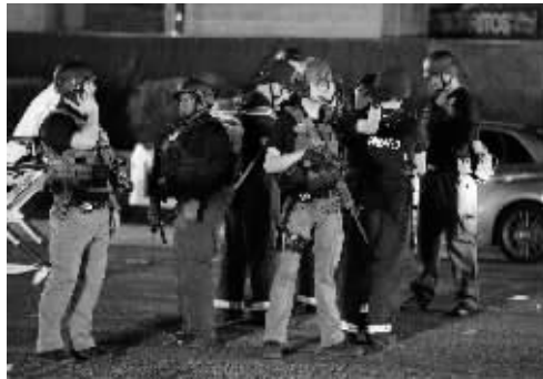
警察在枪击事件现场警戒

美国西部城市拉斯维加斯当地时间10月1日晚上突发一起严重枪击案,至少50人死亡,超过400人受伤,是美国历史上伤亡最大枪击案。