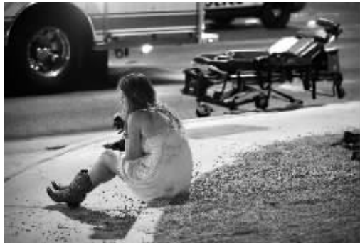
一名女子坐在枪击事件现场附近的马路旁