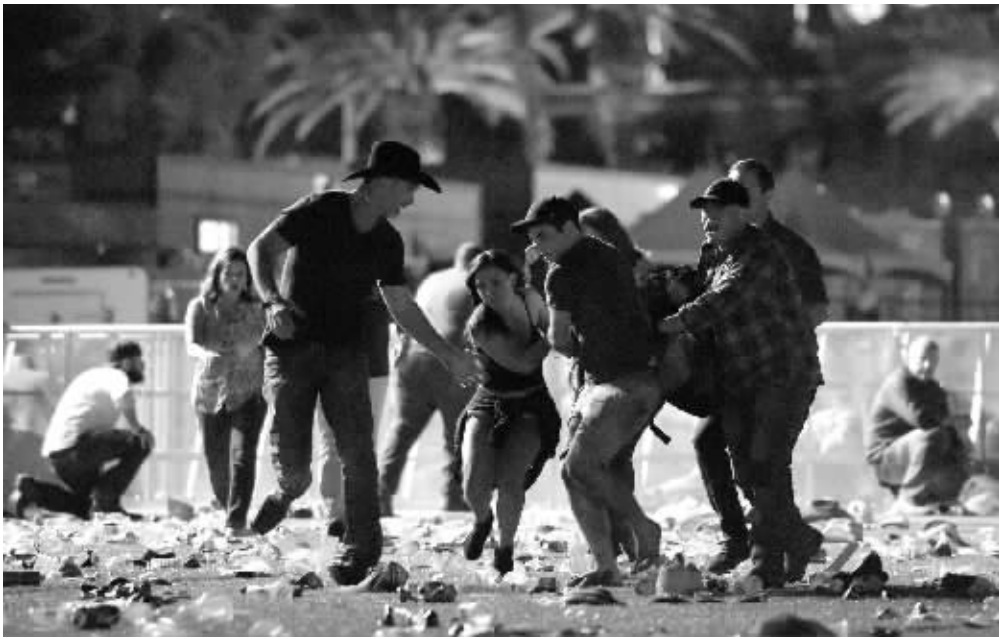
人们在现场救助伤者