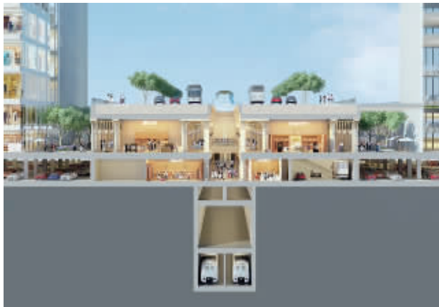
地下空间效果图

下七层。”葛洲坝集团第一工程有限公司相关负责人表示,中央商务区站和滨江站设计采用“U”形布局,通过站台端部两两换乘及换乘站厅夹层逆时针换乘,实现三线之间无缝换乘。届时,出了地铁口就可以通过一个分层直达的通道直接到达目的区域,不需要各种绕,十分方便。