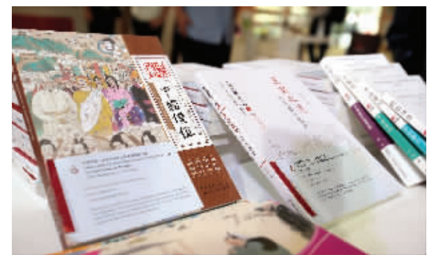
凤凰出版传媒集团新书签约发布

记者了解到,这本书由30位文史专家和书画艺术家共同打造,从中华五千年文明史中精选出60个经典故事,并以300余幅连环画的形式与读者见面。让读者能在生动形象的图画中寻找中华文脉中的根和源。