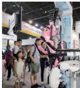
参观者进行智能制造VR体验