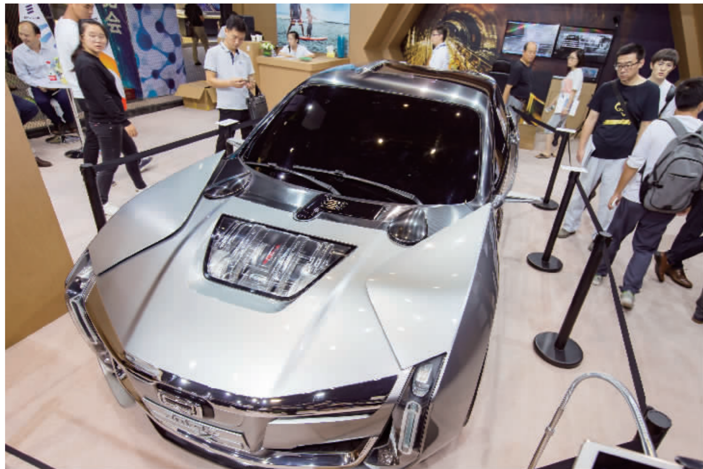
观众在参观5G智能网联汽车