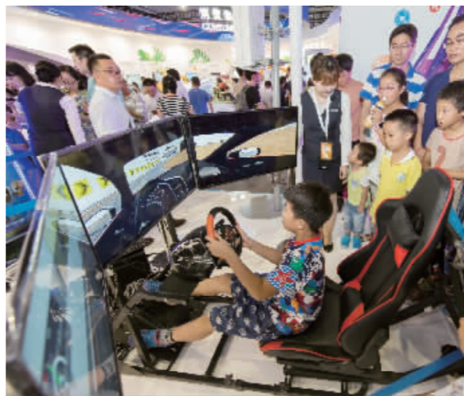
参观者体验智慧交通

约项目40个, 金额总计8亿元。此外, 通过物联网开发者大会、全国大学生物联网设计竞赛和创投项目路演等活动的举办, 20项创新成果在无锡转化, 近100项创新成果引起了各方资本关注。