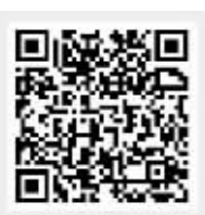
看更多内容请扫码