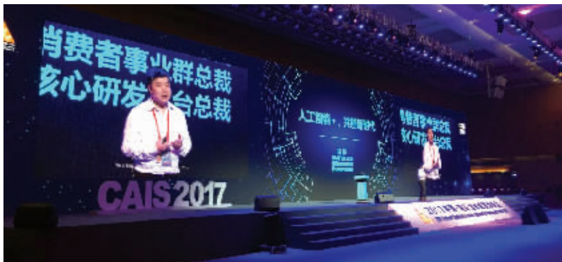
2017中国·南京金秋经贸洽谈会内容丰富,这是中国人工智能峰会

见习记者 谢毓灵 现代快报/ZAKER南京记者 张瑜 李颖鑫 通讯员 何晓进 张帆 亮亮