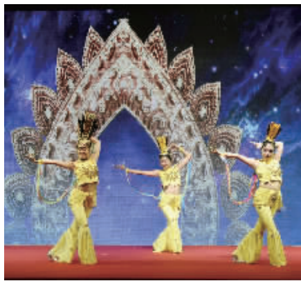
舞蹈表演：敦煌盛世