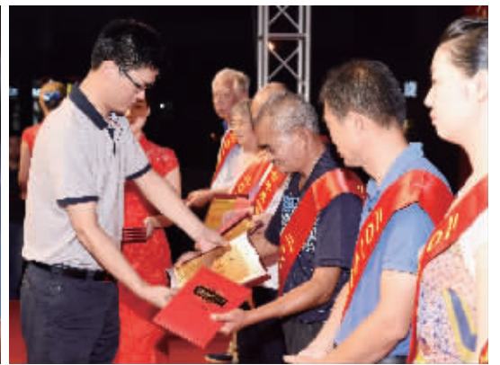
奖状颁发者们荣获为山上叶长镇、记书副委党镇湖鹅