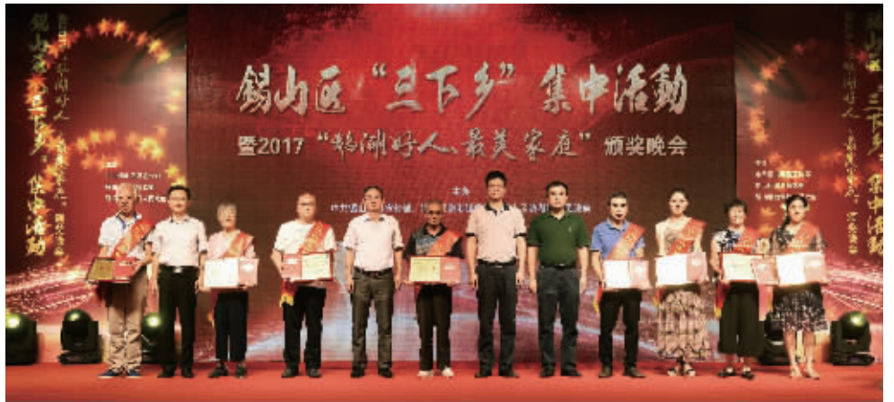
获奖者与颁奖嘉宾合影