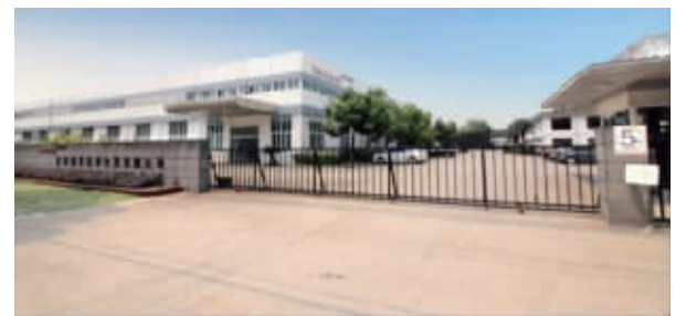
园区重点产业：印刷包装产业