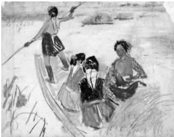
苏天赐《江南秋熟稿》