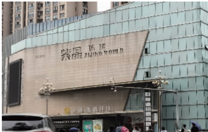
位于南京大厂十村转盘的紫晶环球广场