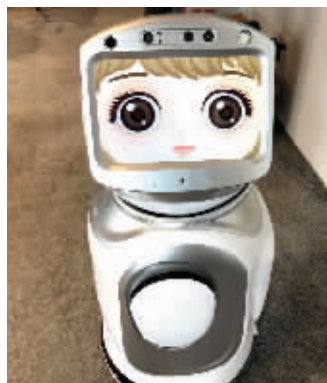
将展出的机器人(左)和VR手机