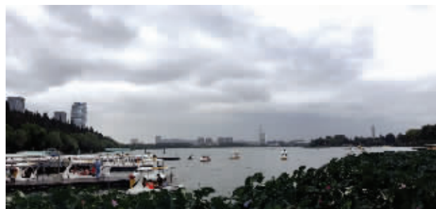
昨天,南京上空乌云压顶,凉意袭来

快报讯(记者 徐岑)什么是一夜入秋?到江苏,你就知道了。从36℃跌到26℃左右。24小时内,南京最高气温下跌了10℃左右,有小伙伴们表示,加上刮风下雨,这两天出门都有点冷!本周,持续雨水模式,全省最高气温都在“2”字头,感觉初秋就快来啦!