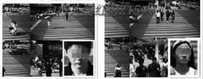
首日抓拍行人闯红灯215人