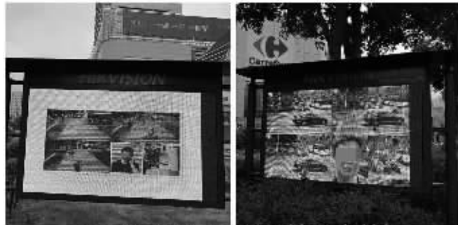
“人脸识别系统”首日抓拍