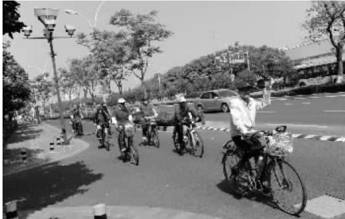
葑行自行车队的骑行队伍