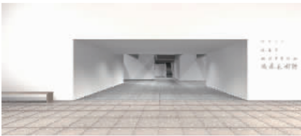
德基美术馆效果图