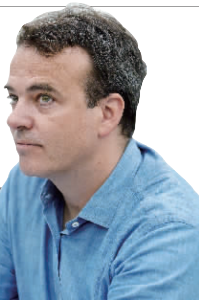
德基美术馆的设计者菲利普·门泽