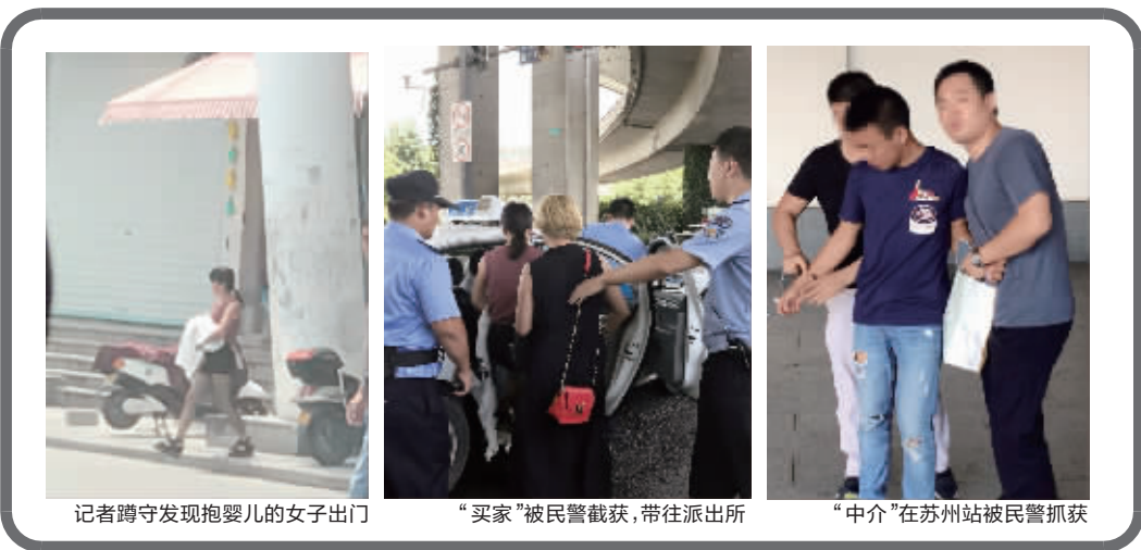
记者蹲守发现抱婴儿的女子出门