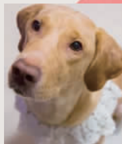
给爱犬织了一个蕾丝围脖