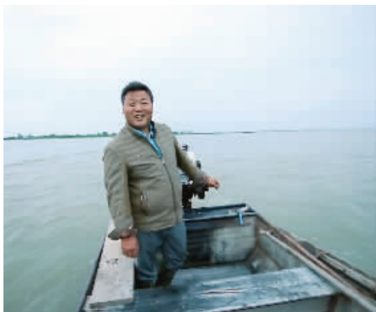
凌晨,骆师傅和渔业合作社的渔民一起捕鱼

白马湖有一个美丽的传说,相传天上的神马下凡化作书生与荷花仙子相恋。玉帝暴怒,暴雨倾盆,地面顿成水乡泽国。荷花仙子为救百姓,抛莲子化岛,神马也化作一湖秋水。如今,从空中俯瞰白马湖,还能看到湖体呈白马的形状。