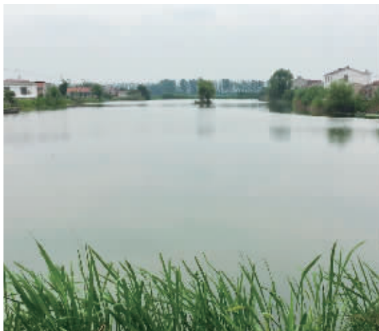
如今王骆店岛中间的小湖看上去干净美丽