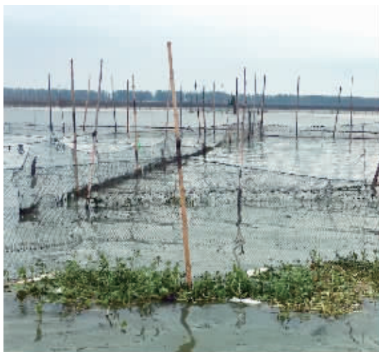
曾经的白马湖就是这样围网遍布