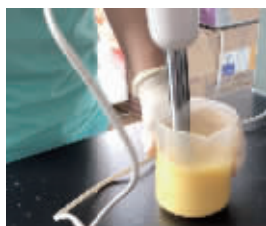
水果打成浆,准备进行酸度检测