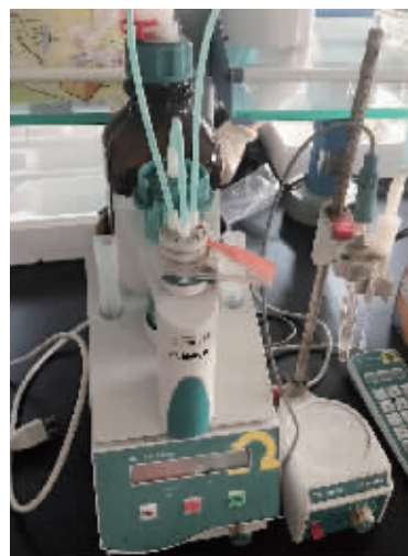
滴定仪测量可滴定酸含量

评测地点: 江苏省农科院果树研究所国家农作物种质资源共享服务平台——桃草莓种质资源子平台(南京)