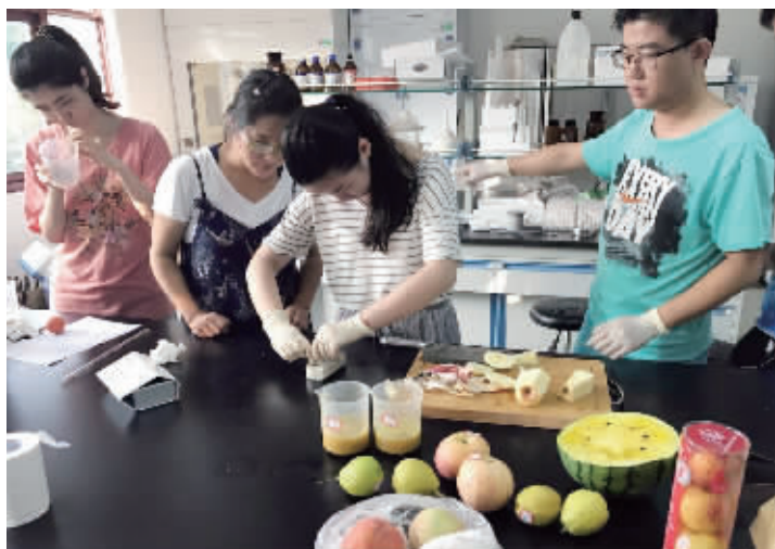
评果评测员在做实验