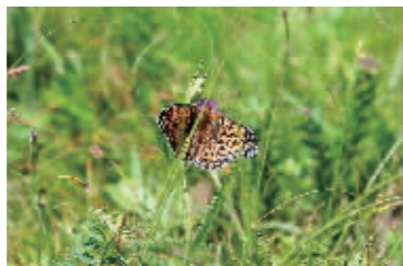
塞罕坝如今已成为植物和动物的天堂