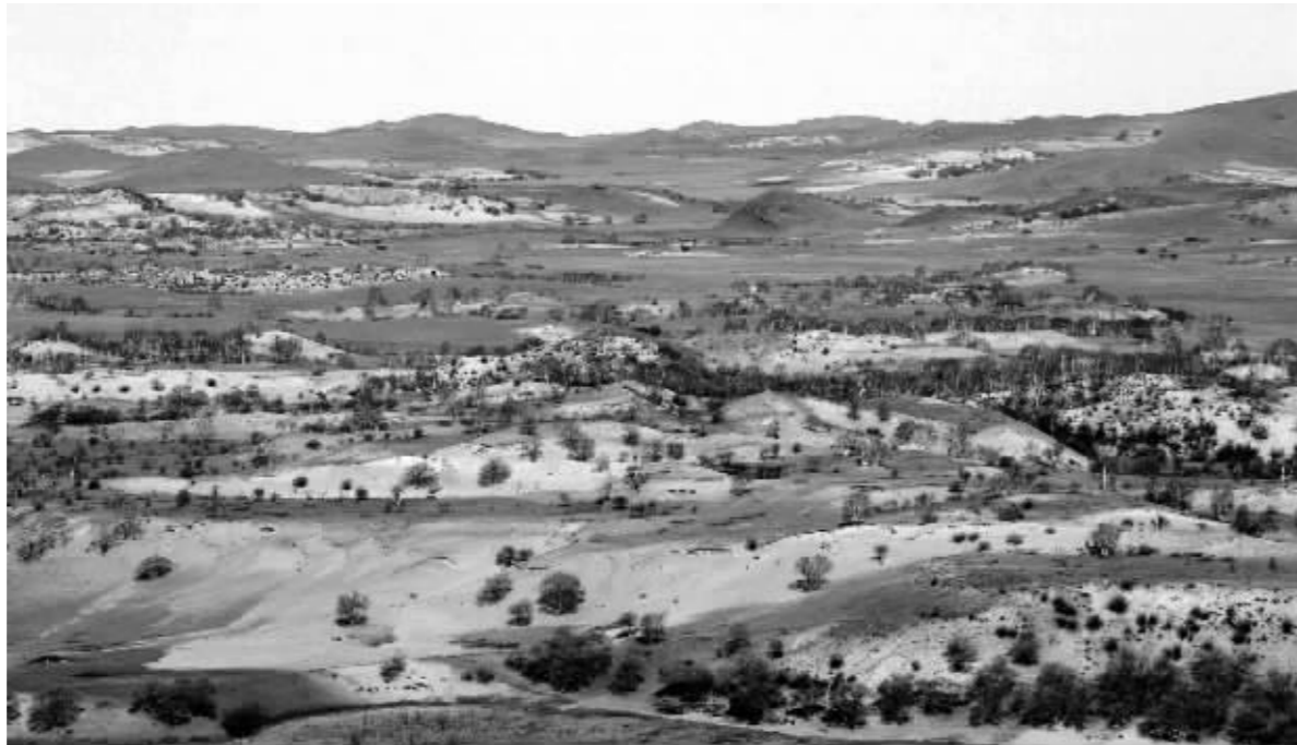
建场前这里是一片荒原

这里,是中国北方的神秘氧吧。 这里,是世界最大的人工森林。 这里有112万亩林海,4.8亿棵树木,排起来可以绕地球12圈! 你难以想象,55年前,这里还是黄沙蔽日、遍野荒芜的寥落之地。 因为清末的开国放垦加之山火不断,昔日康乾盛世水草丰美的皇家猎场从此沙土流失、林木殆尽…… 你更难以想象,新中国成立后,接连三代人前赴后继,像“钉子”般扎根在这里,在短短的55年间,硬是在荒原沙地上,徒手种出百万亩森林! 这片创造传奇的土地,名字叫做“塞罕坝”! 日前,现代快报团队深入塞北高原探寻300年变迁史,并精心制作了13分钟的专题纪录片,解密令人震撼的四大真相。