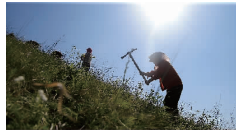
石质阳坡攻坚造林