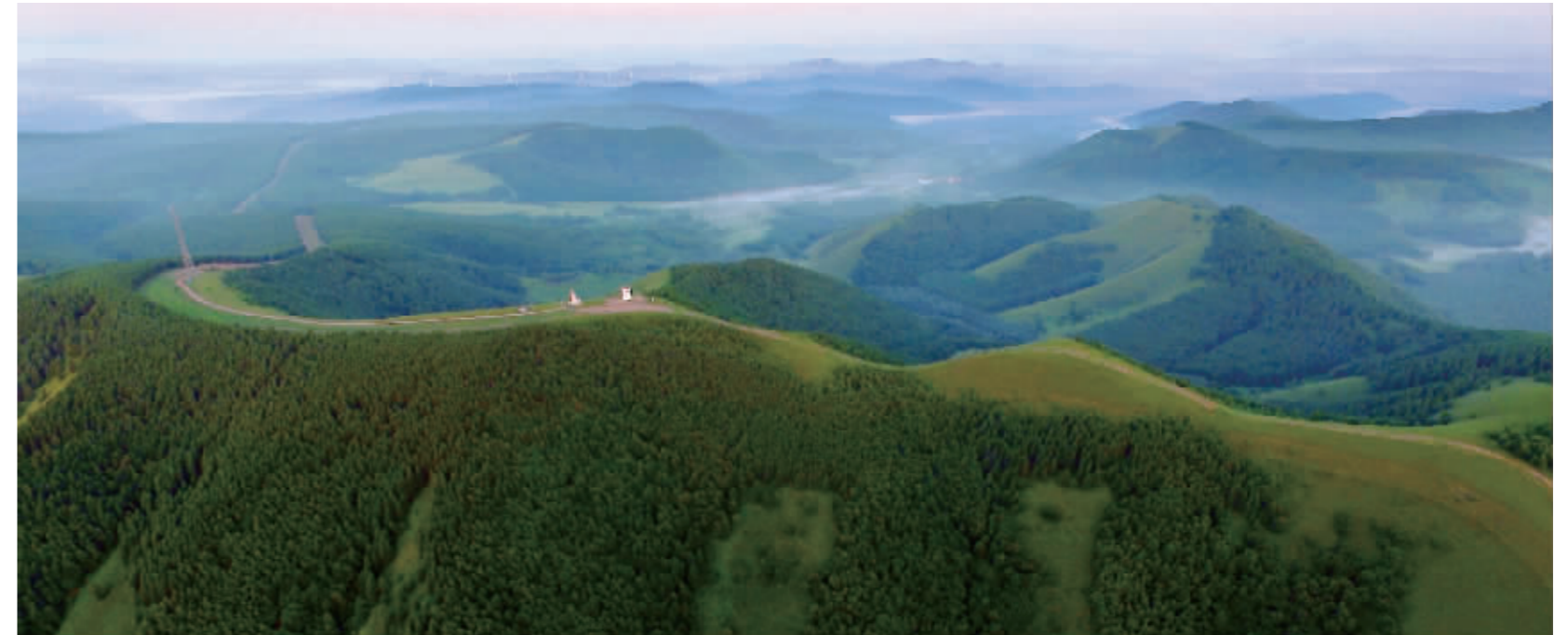
航拍塞罕坝,满眼都是绿色