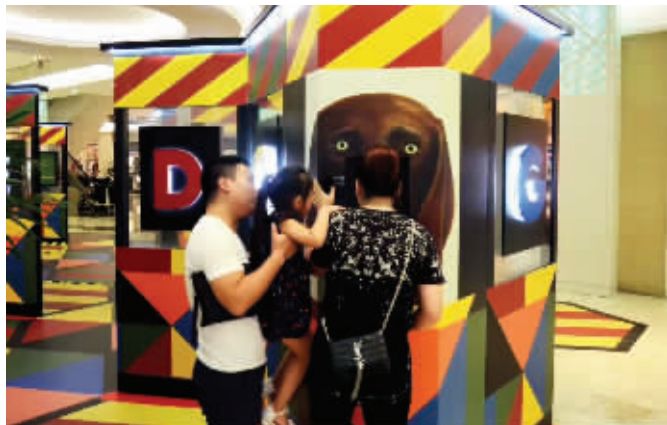
南京虹悦城正在举办的大型视觉科普展