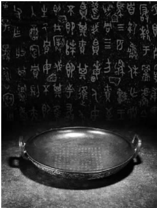
青铜兮甲盘:高11.7cm、直径47cm