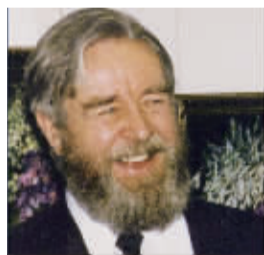
阿列克·阿尔基马索夫·伊万诺维

他的画风诚恳而真实,其油画擅长以历 史画面为题材进行主题创作,同时也包括风 景、静物、日常生活中的画面。作品被中国、沃 罗哥达州立画廊、沃罗哥达国立历史建筑与 艺术博物馆、俄罗斯及国外的私人藏家收藏。