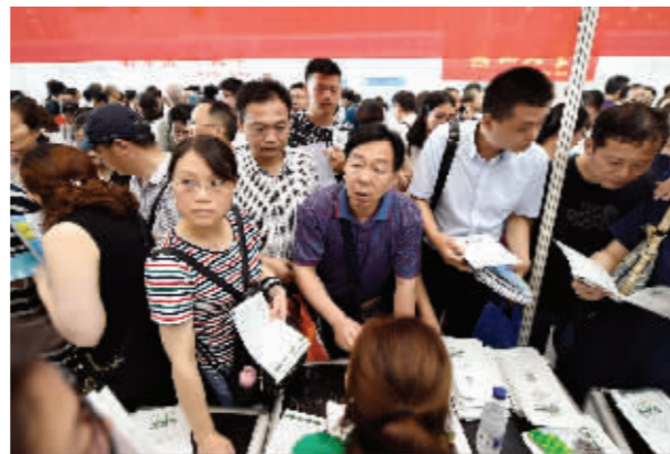
到场的考生和家长们对如何填报志愿都十分关心,现场咨询热烈