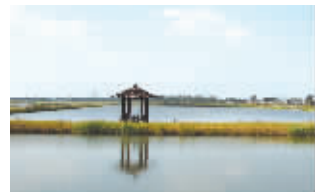
盐龙湖饮用水源保护区

据了解,盐龙湖畔共造林3000亩,除了成片林,还种植枇杷、薄壳山核桃等经济林果,力促林木效益化。一棵棵绿植组成一片片绿林,最终汇成一片林海,他们像战士一样立于盐龙湖畔,守护着这个关乎500万人饮水的水源地。