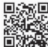
扫描二维码 加入80后交友圈

现如今,很多年轻人由于工作繁忙无暇顾及情感问题,甚至没有时间谈对象,然而操心的父母可是急坏了。周日,我主良缘高端婚恋“妈妈相亲团”再次出击,为爸妈们排忧解难!集结南京想帮儿女找优质单身的父母,想给孩子找个好对象,赶紧报名吧!