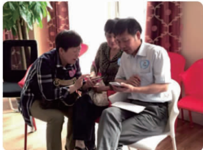
□ 往期“妈妈相亲团”现场,父母交换子女信息

选择少、工作忙,儿女至今未娶待嫁。6月18日(周日),我主良缘推出的“妈妈相亲团”,为忙碌的适婚单身们提供便捷相亲方式,邀请父母出马为儿女物色对象。咨询热线:87799520