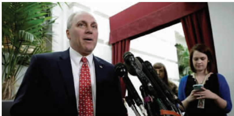
美国众议院共和党党鞭史蒂夫·斯卡利斯 资料图片