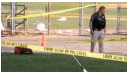
发生枪案的球场已被封锁

当地时间14日早上,美国华盛顿特区南部弗吉尼亚州亚历山大市一处棒球场发生枪案,美国国会众议院共和党党鞭史蒂夫·斯卡利斯遭枪击受伤,枪手已落网。