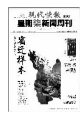
上期星期柒新闻周刊封面