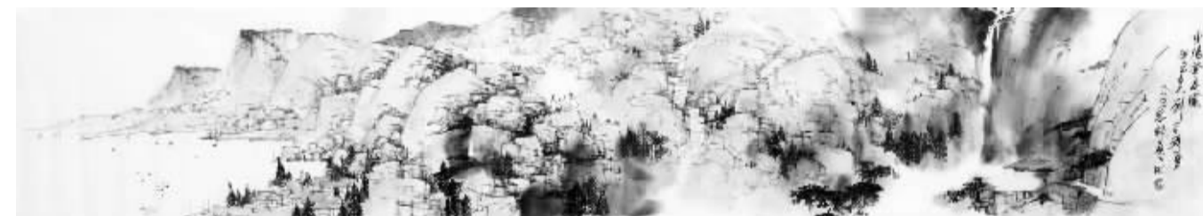
刘守瑶《重阳登高图》