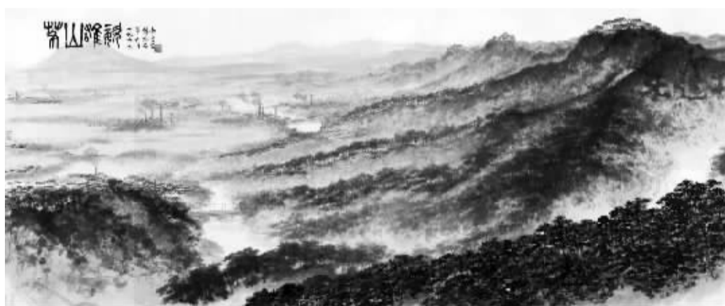
傅抱石《茅山雄姿》(局部)

为何它能够拍出如此高的价格?其中又有怎样的故事?《茅山雄姿》作为傅抱石在中国美术史上留下的一个感叹号、个人艺术生涯的一个完美的句号,又有怎样的魅力?