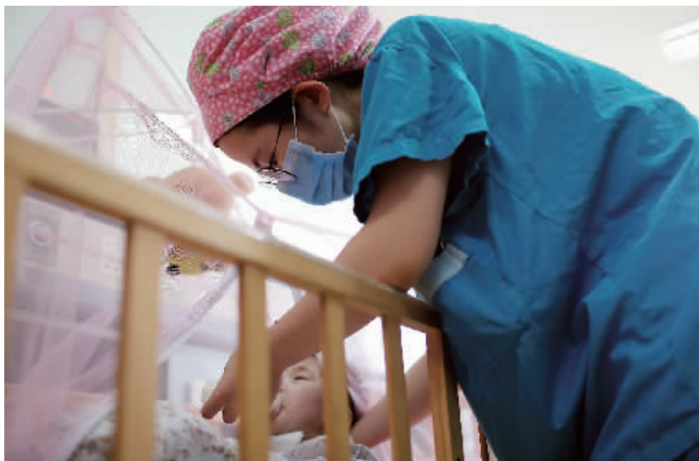
护士正在给地球喂奶