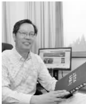
南京师范大学党委书记宋永忠