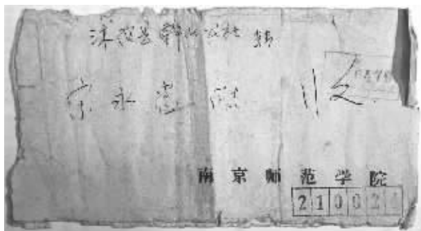
学校寄来的录取通知书的信封