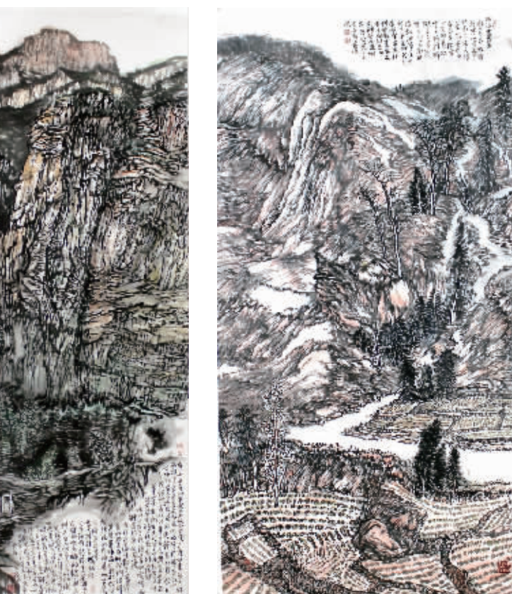
《有一个不争的事实》