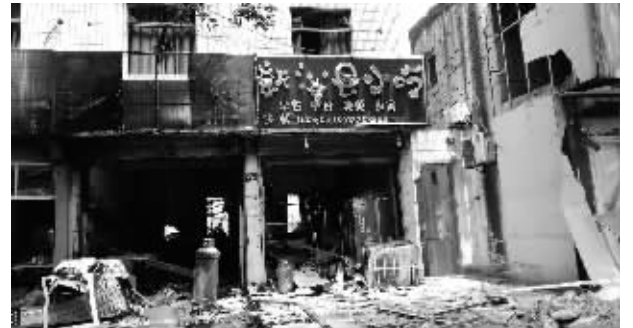
爆炸过后,一片狼藉