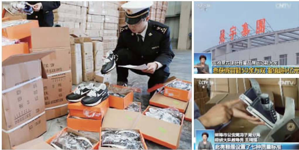
警方查获大量假冒名牌运动鞋

安徽蚌埠警方经过历时一年多的缜密侦查,破获了公安部督办的假冒品牌运动鞋案,查扣各类假冒品牌运动鞋50余万双,涉案金额达6亿多元,这也是目前国内最大的假冒品牌运动鞋案。