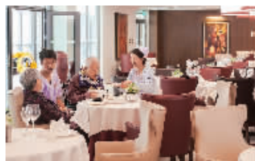
助餐服务 颐养中心供图