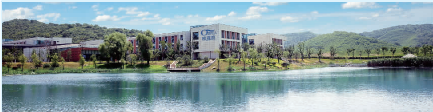
欧葆庭仙林国际颐养中心全景