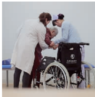
一对一康复

据了解,与传统药物治疗相比,非药物治疗副作用风险更低,也更适合老人,能从生理和心理上帮助老人由内而外缓解不适。